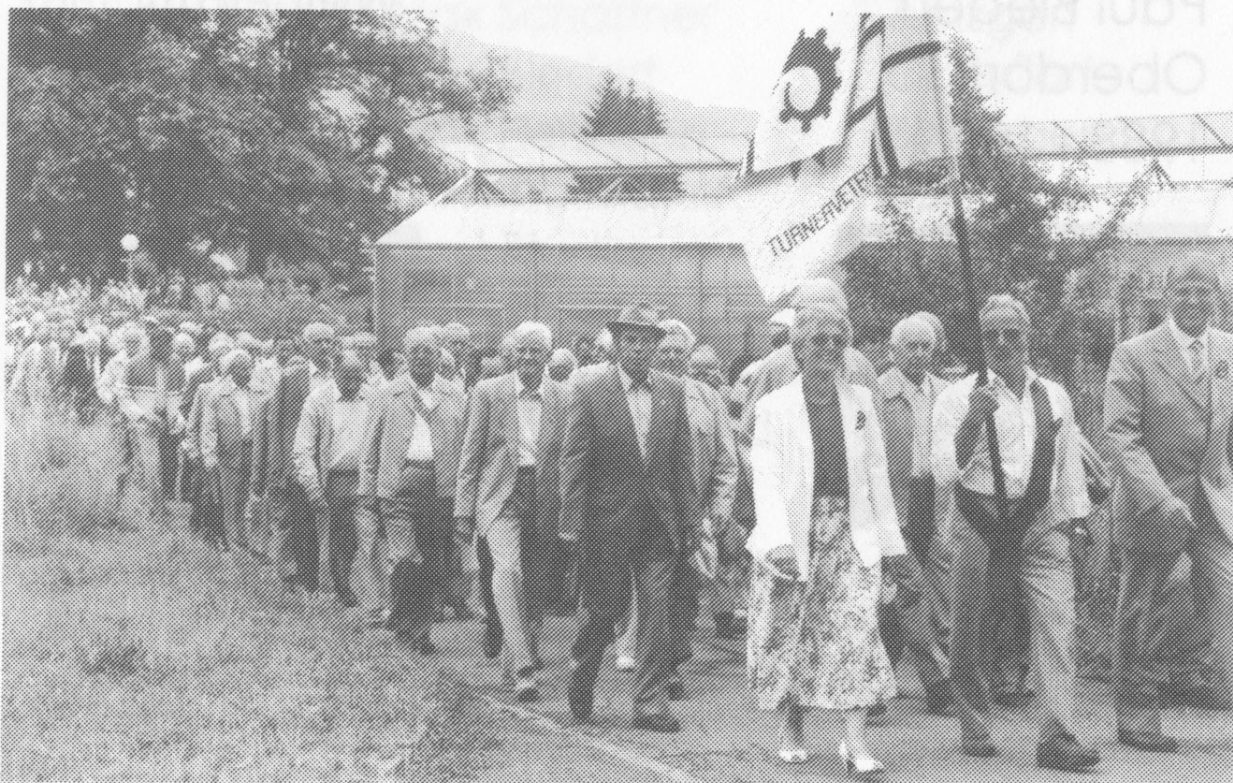
Veteranentreffen am Kantonaltturnfest in Sissach 1989.